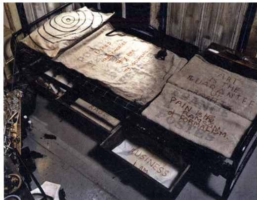
Şekil 6: I Need My Memory (Anılarıma ihtiyacım var: Onlar Beni Belgeliyorlar)

“Heykelim bir imge değildir, bir fikir de değildir. Ben araştırıyorum. Yaptığım atıf geçmişteki bir duygudur. Sanatım bir şeytan kovma durumudur. Heykelim korkuyu yeniden deneyimlemem için izin verir bana. Böylece onu uzaklaştırabilirim. Bugün heykelimde geçmişte çözemediğim şeyleri söylüyorum. Bu, bana geçmişi yeniden deneyimleyebilmeyi ve onun gerçek boyutunda ve tarafsızlığında geçmişi görebilme fırsatını veriyor. Korku pasif bir durumdur ve maksadımsa onu aktifleştirmek ve kontrol edebilmek, onu, bugün ve burada yalnız bırakmaktır. Pasiflikten aktifliğe doğru bir hareket. Çünkü eğer geçmiş reddedilirse, bugün yaşayamazsınız. Geçmiş korkuları beden işlevleriyle bağlantılandırıldığı için onlar beden olarak görünürler. Benim için heykelim bedenimdir, bedenimse heykelimdir.” (Kotik, 1994, s.12).