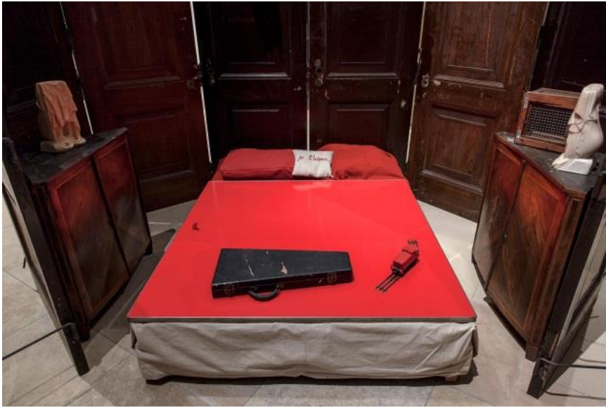
Şekil 4: Red Room (Parents) Kırmızı Oda 1994 ( https://bourgeois.guggenheim-bilbao.eus )

Sanatçının sanatsal üretiminde çok önemli bir yeri olan ve duyguların katkısıyla ortaya çıkan heykellerinden biri olan Maman heykeli (Şekil 3) 9 metre uzunluğunda paslanmaz çelikten yapılmış, karın ve göğüs bölgesi bronz, kesesinde 26 adet mermer yumurta bulunan örümcek formu ile annenin gücünü ve korumacılığını tasvir etmiştir. Örümcek formu sanatçının annesini ve kendisini mitolojik olarak da en iyi anlatan figür olmuştur. Yunan mitolojisindeki Arakne harikulade güzel kumaşlar dokuyan bir kadındır. Ustalığı Tanrıça Athena'yı bile kızdırır. Sonunda ikisi arasında yarışma yapılır. Athena babası Zeus'a yaraşır şekilde dokuduğu kumaşta Olympos tanrılarının zaferlerini tasvir eder. Arakne ise bu ataerkil tanrıların kadınlara karşı Yunan mitolojisindeki işledikleri suçları, çektirdikleri acıları dokur. Arakne'nin çalışması Athena'yı bile etkiler ve Arakne'yi öldürmeye kıyamaz, onu örümceğe çevirir. Bourgeois'ın zanaatçı olan annesi de Arakne gibi atölyesinde ipliklerle uğraşıp halıları tamir etmektedir. Uğradığı ihanete karşı bir örümcek gibi sakin ve sessizdir.