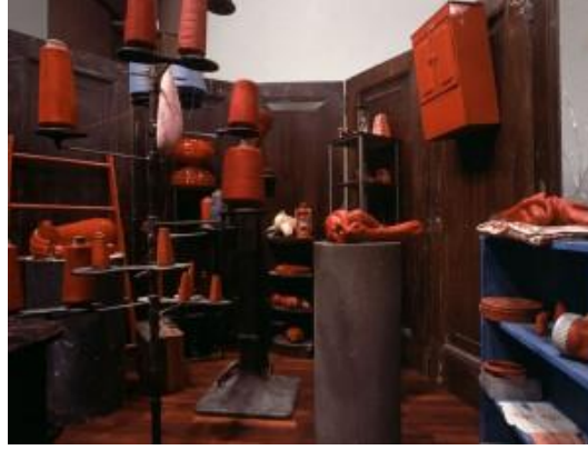
Şekil 5: Red Room (Child) Kırmızı Oda 1994 ( http://www.newsofheartworld.com )

Bourgeois'in çocukluk hatıraları (Şekil 4), aile içi durumları yaşam boyunca eserlerine konu olmuştur. Çalışmada bulunan dikiş malzemeleri kırmızı iğneler ve ipler çocukluğundaki halı restorasyonu atölyesini anımsatmaktadır.