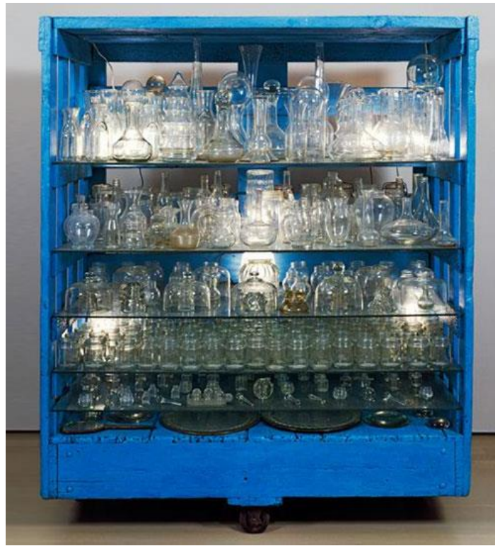
Şekil 7: Le Defi (Meydan Okuma) 1991( https://www.guggenheim.org/artwork/653 )

Geçmişini anlatan bir figür olarak Bourgeois kişisel kayıbdan korunduğunu söyle ifade eder; “Üretmezsem çıldırabilirdim. Bir şekilde bunlardan kurtulabilmeliydim.” Sanatçı geçmişinden kurtulabilmek ve geçmişini yeniden yaratarak hayatta kalabilmek için eserlerini üretir. (Şekil 6) “Hücre”(Cell) serisinde, anıları temsil eden metaforlarla farklı nesne düzenlemeleri yaparak geçmişin anıları ile şimdiki koruma altına alır. Bourgeois bu seride hücre adını verdiği çeşitli odalar yaratmıştır. Hücrelerin içleri çeşitli eşyalarla doludur. Bu eşyalar geçmişi anımsatan nesnelere seçilerek birbirleriyle ilişki içinde sunularak her bir hücre onun kişisel müzesi haline dönüşmüştür” (İlter, 2006, s.30).