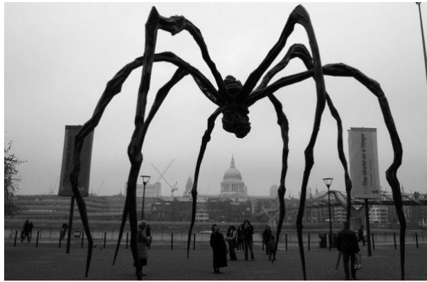
Şekil 3: Maman (Anne) 1999 ( http://sanatkaravani.com )

Üç çocuk annesi olan sanatçı annelik, doğurganlık, hassasiyet, kırılabilirlik gibi pek çok özelliği taşıyan kadını eserinde (Şekil 2) evlere dönüştürmektedir. Sanatçı kadın evler ile evin içinde geçirdiği zamanı, bedeni dışarda iken zihnin evde olduğunu, Amerika’da yaşarken Fransa’ya evine duyduğu özlemi sembolik olarak yansıtmıştır. Eser (Şekil 2) kadınlar tarafından evdeki kadının kimliğinin ortadan kalkması ve kadınlara bir yardım çağrısı olarak okunmuştur.