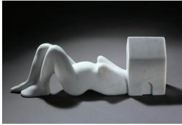
Şekil 2: Femme Maison (Kadın Evler) 1994 ( http://www.banucarmikli.com )

Kendi travmalarından yola çıkan sanatçı, zengin malzeme çeşitliliği ile kendini sınırlandırmadan travmasını doyasıya yaşarken kendi içsel yolculuğunun yanı sıra bir kadın olarak eserlerinde kadının toplumdaki rolünü de sorgular.