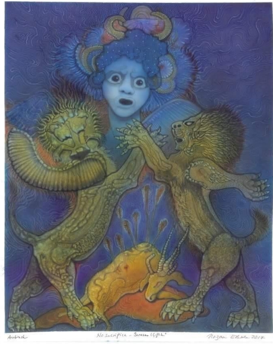
Görsel (5): Scream

Bratislava Bienali kapsamında “Göç Bebekleri” isimli illüstrasyon sergisinde yer alan eseri Görsel 6’da görülmektedir. Bienale gönderilen eserler içerisinde kuş imgesinin bulunması mecburi tutulmuştur. Görsel 6’da görülen çalışmada bir kuşkanadının bir kadın figürüne ilişitirildiği görülmektedir. Sanatçı eserini yaparken gözyaşları içinde tamamladığını söylemektedir. Seçilen renklerin, imgelerin hüznü ve seçilen mavi renk sanatçının ruh durumunu ifade ettiği söylenebilir. Bu eserler kartpostal olarak dünya çapında birçok yere ulaştırılacağı söylenmektedir.