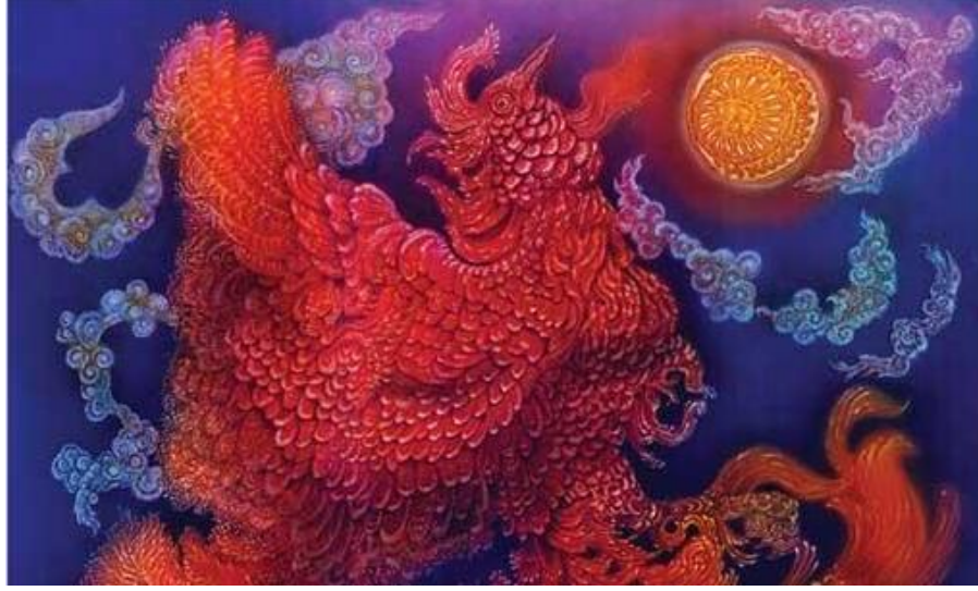
Görsel 1: Zümrüdü Anka Kuşu Serisinden bir eser

Kelebekler Serisi: Düşler ve Karabasan eserlerinde bulunan kelebek imgelerinin kadınlardan ilham alarak oluşturduğunu anlatmaktadır. Kadınları bir kelebek olarak betimleyen Erkmen, kadına yönelik şiddeti bu eserlerinde yansıtmaya çalıştığını söylemektedir. Kadınları kelebek kadar narin, estetik, duygulu olarak gören ve kadına yönelik şiddet sonucu ölen kadınların bir anda hayattan koparılması bu sebeple kısa süreli ömürlerinin olduğunu betimler eserleri. Zümrüdü Anka serisinde ise betimlediği figürlerinde küllerinden yeniden doğan kadınları anlatmaktadır. Kollarının altında koruduğu çocukları ile bir savaşı anlatır. Kadının her zaman üretken, başarılı, yenilikçi, ailesine bağlı yaşama yeniden şekil veren kadınların anlatımı olarak yorumlamaktadır.