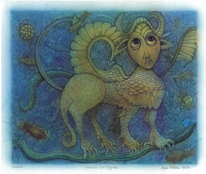
Görsel (4): Regret and Illusion

ArtTurkey Japan Sergisinde, “Çılgılık” ve “Hüzün” isimli eserleri ArtTurkey Japan Sergisinde, Bungei Özel Ödülüne lâyık görülen “Regret and Illusion (Görsel 4)” ve “Scream(Görsel 5)” isimli eserleri kadını anlatmaktadır. Bu eserler her gün katledilen kadınların verdiği acı ve hüznü anlatmaktadır. Erkmen’in eserleri incelendiğinde kendine özgü tarzı, renkleri ve stili göze çarpmaktadır.