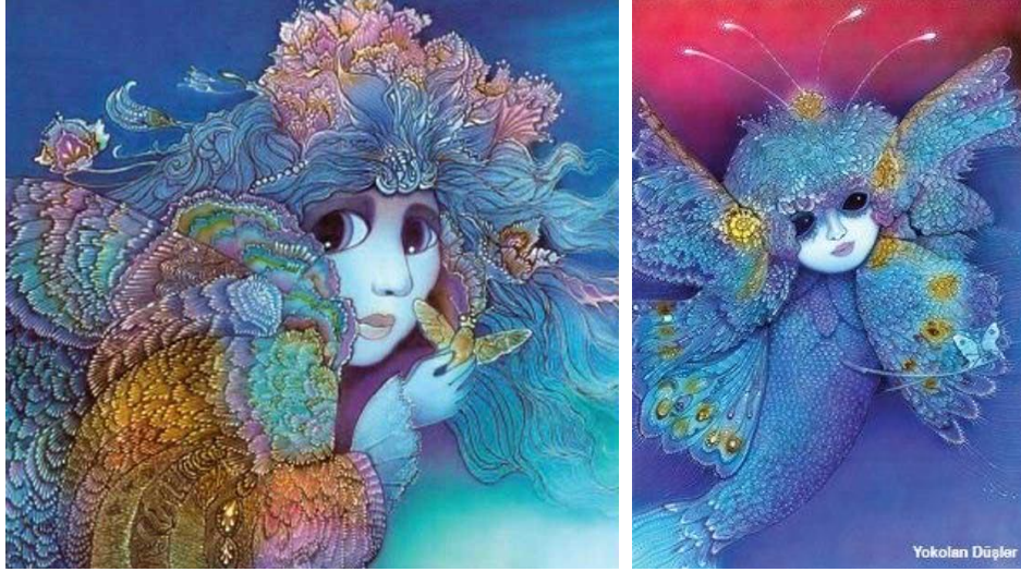
Görsel 2: Düşler ve Karabasanlar Serisi

( http://turkishpaintings.com/index.php?p=37&l=1&modPainters_artistDetailID=1114 )