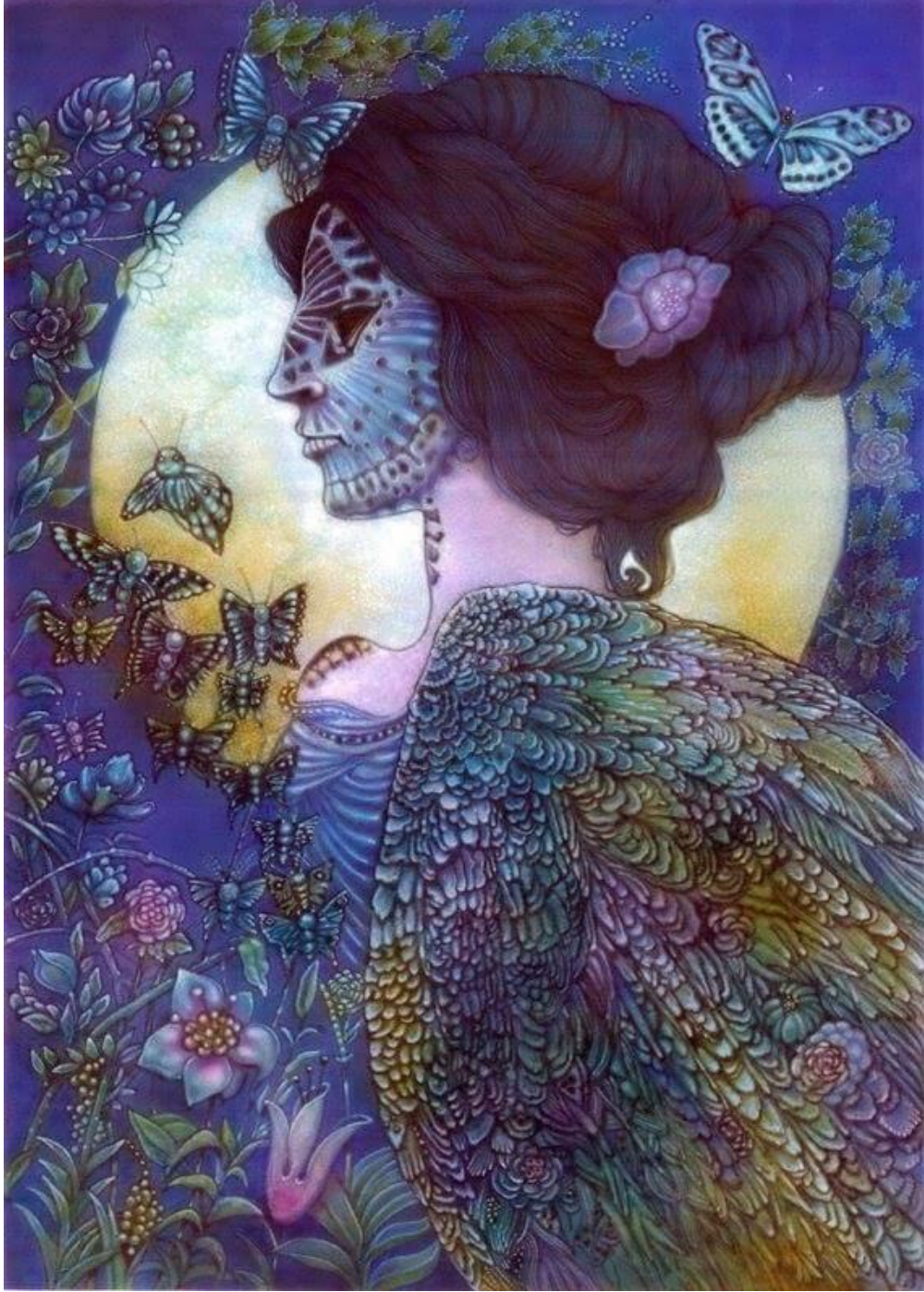
Görsel 7: Nazan Erkmen İllüstrasyon çalışmalarından (Nazan Erkmen arşivi)

Görsel 7’de görülen çalışması yine kadınları konu alan bir eserdir. Erkmen bu çalışmasında kadınların yaşama can katan üstün varlıklar olarak her türlü mücevherden daha değerli olduğunun fark edilmesi gerektiği ifade etmektedir. Çalışmasında yine soğuk renklerden mavi rengi tercih ettiği görülmektedir. Kadının renkli dünyasını anlatan renklerinde mevcut olduğu görülmektedir.